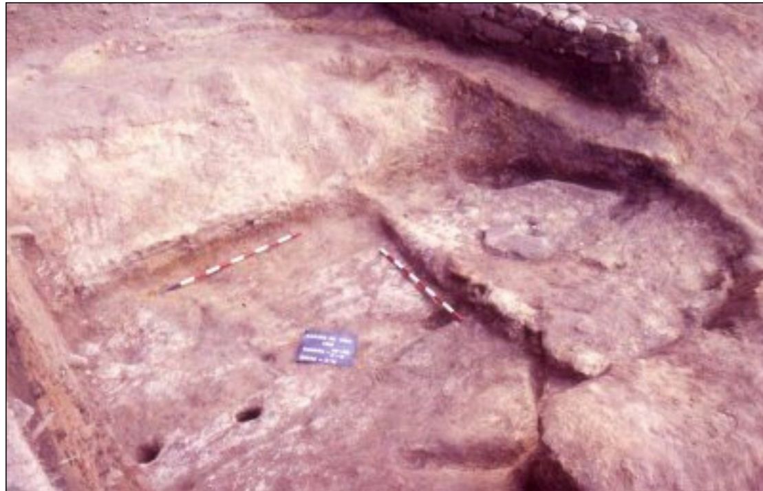
Fotografía da campaña de escavación de 1986. (Autor J.M. Hidalgo Cuñarro)