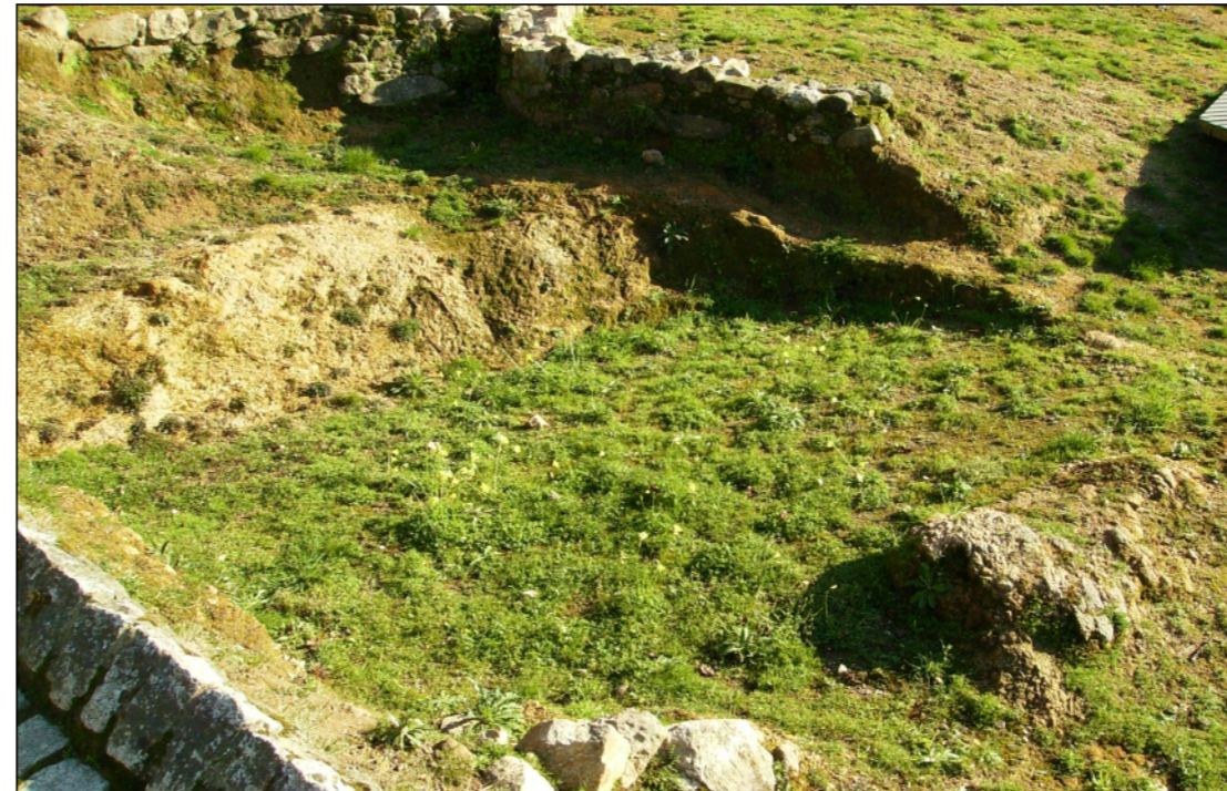
Fotografía actual, trato proceso de musealización.