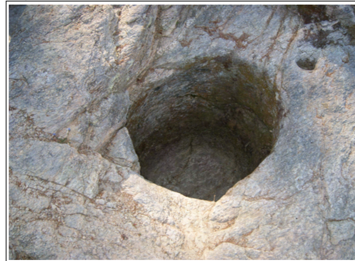
Silo de almacenaxe.