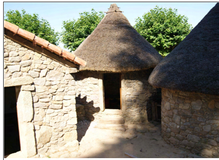
Almacén de produtos vexetais.