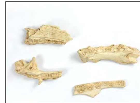
Osos de peixe.

Agora que chega o verán, comenza a operación bikini e estamos máis preocupados pola nosa alimentación, imos falar da dieta dos castrexos. De que se alimentaban? Como conseguían as súas provisións? Como as almacenaban e conservaban? Nunha economía eminentemente agraria, a principal achega alimenticia sería a base de produtos vexetais. Os animais domésticos eran aproveitados sobre todo polas súas achegas en forma de leite, la, esterco ou forza de tiro, e non se consumiría a súa carne ata que foran vellos. Nun castro costeiro como o de Vigo, o aproveitamento dos recursos mariños (pesca e marisqueo), sería outro pilar da súa alimentación. Na caseta de acceso ao xacemento poderedes pedir información máis extensa sobre a dieta dos castrexos. Bo proveito.